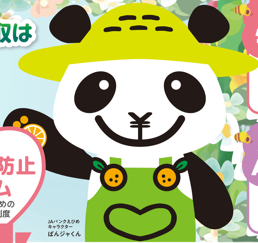
JAバンクえひめ キャラクター ばんじゃくん